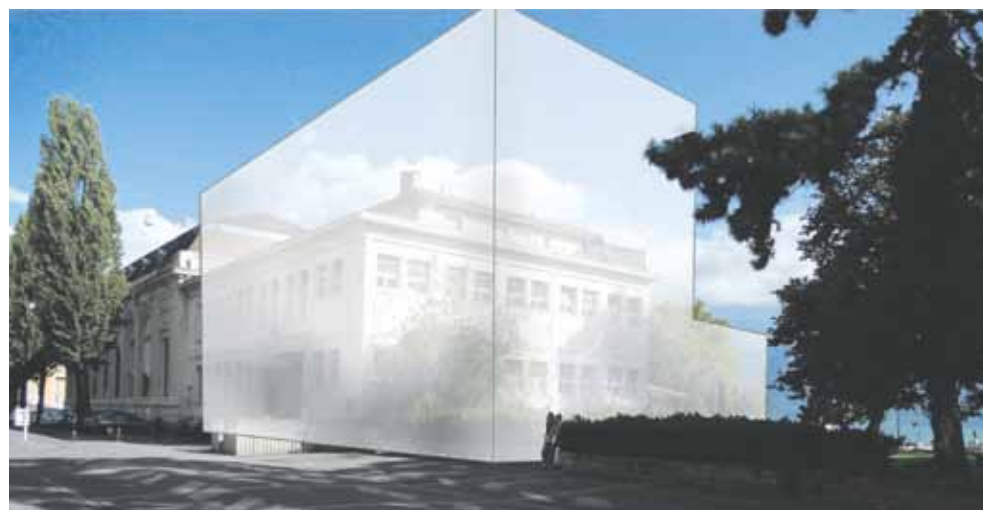
Les volumes permis par le PPA